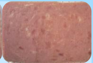
Aussehen wie Corned Beef

Diese Produkte bestehen meist aus schnittfesten, stärkehaltigen Gelen , in die kleinste oder auch deutlich sichtbare Fleischstücke eingebettet sind. Sie unterscheiden sich hinsichtlich Zusammensetzung, Aussehen, Geruch und Geschmack grundlegend von den Produkten, die sie ersetzen sollen.