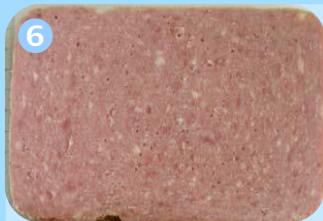
Aussehen wie Brühwurst

Häufig finden in der Gastronomie Erzeugnisse Verwendung, die hinsichtlich ihrer geweblichen und stofflichen Zusammensetzung einen grundlegend anderen Charakter als die zuvor beschriebenen Produkte aufweisen. Es handelt sich nicht mehr um „Schinken“, „Vorderschinken“ oder „Schinken aus Fleischstücken zusammengefügt“, sondern um Produkte eigener Art , sog. Aliuds . Beispiele: