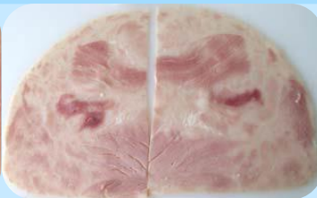
Aussehen wie Schinkensülze